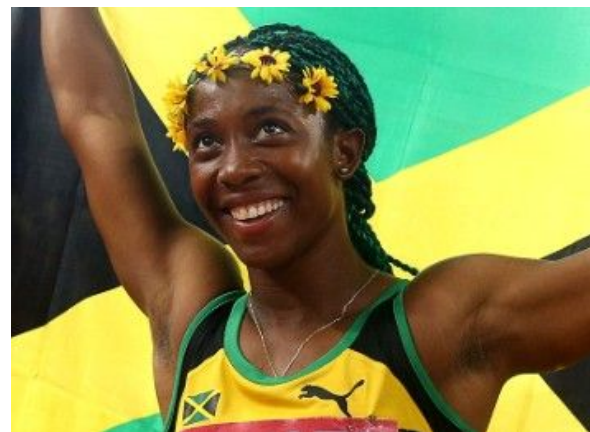
Shelly Ann Fraser Pryce (Sprinter; 100m och 200m)