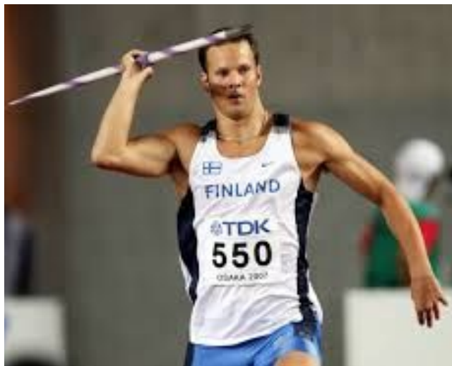
Tero Pitkämäki (Spjut)