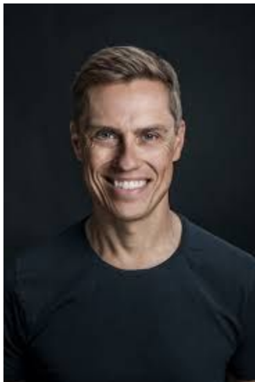
Alexander Stubb (politiker)