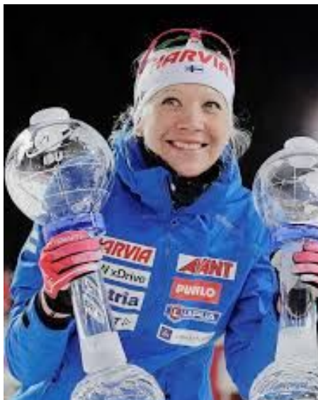
Kaisa Mäkäräinen (skidskytte)