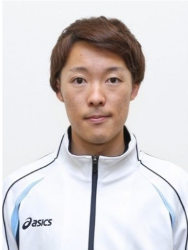
Ryōyū Kobayashi (Backhoppning)